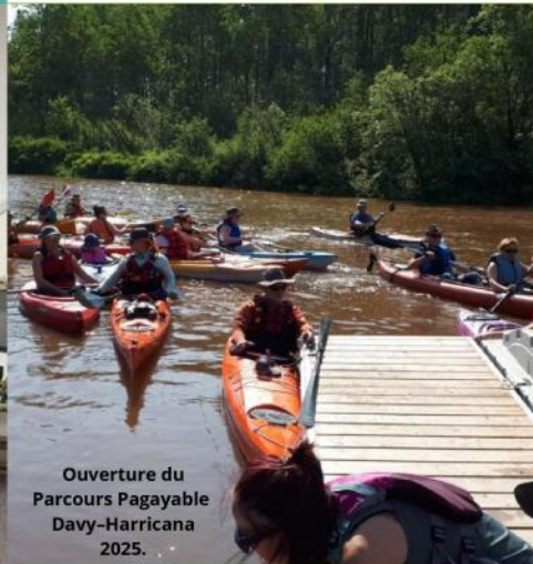
Ouverture du Parcours Pagayable Davy-Harricana 2025.