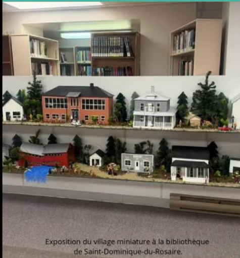
Exposition du village miniature à la bibliothèque de Saint-Dominique-du-Rosaire.